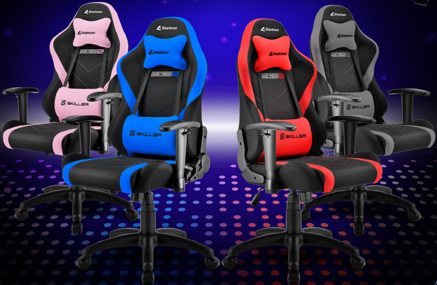
SKILLER SGS2 Jr. Blue